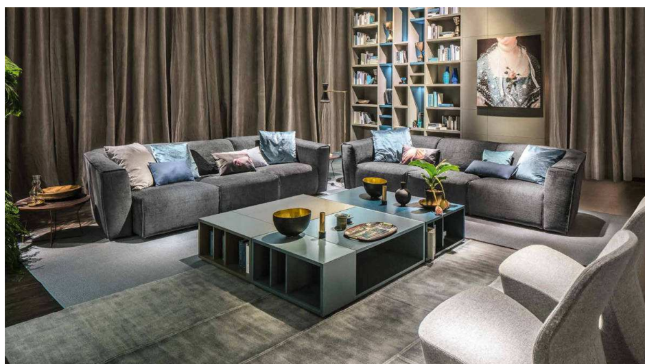
Nella foto: Divano Ladigue, design Enrico Cesana. Ladigue è un divano componibile dallo stile soft e dall'aspetto morbido ed accogliente. Un design valorizzato da morbide pieghe con tagli al vivo nelle sedute