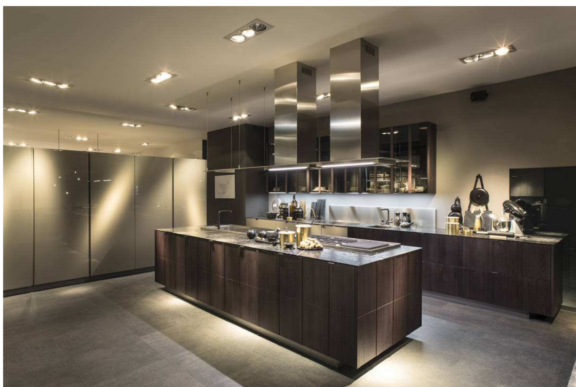
Nella foto: Maggiorana è la nuova cucina componibile proposta da Valdesign a Eurocucina 2016, disegnata da Bruna Vaccher. Realizzata in olmo sabbaiato verniciato ha un aspetto materico e imperfetto. Per contrappunto i pannelli sono scanditi secondo una partitura regolare in orizzontale e verticale segnata da elementi in legno massello che nascondono le aperture. L'effetto è quello di un elemento unico "cassettonato" con un ritmo continuo