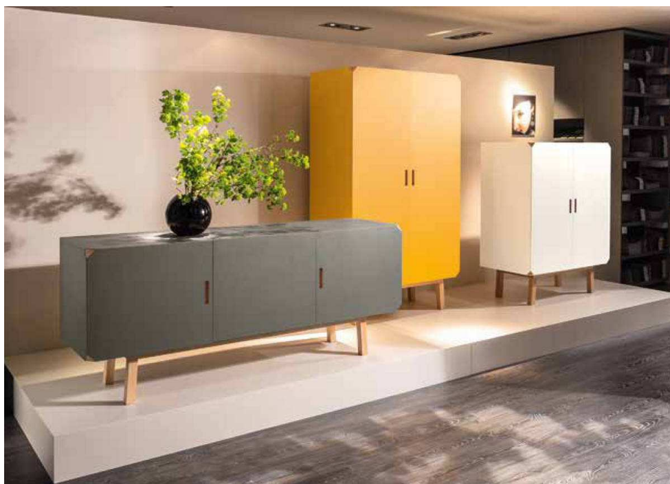
Nella foto: Cartalegno è una collezione di mobili contenitori composta da madie e credenze dal design unico e personale. Si distingue per le superfici rigate piacevoli al tatto e spigoli scapitozzati che mostrano il telaio interno di legno massello