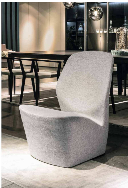
Nella foto: Poltroncina Odette, design Carlo Trevisani. Odette è una poltroncina imbottita e sfoderabile caratterizzata da un unico volume in cui seduta e schienale risultano separate e al tempo stesso continue