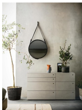
Cassettera Hobby di Alf DaFrè ( alfdafre.it )