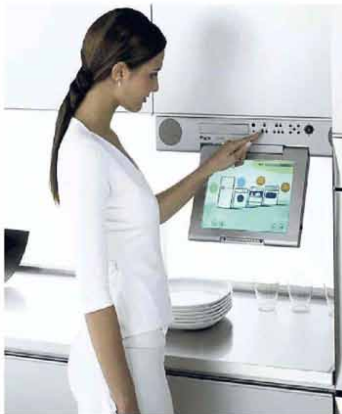
La cucina domotica Snaidero

» Piovesana. «Nulla va più a magazzino, fin dall'inizio della produzione ogni pezzo ora ha nome e cognome del cliente»