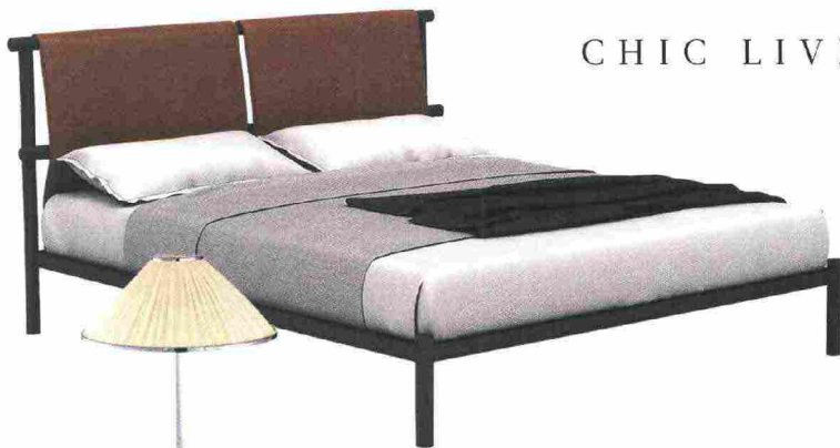
Letto Jetty, struttura in acciaio rivestita in cuoio, design Gordon Guillaumier per Alf DaFré ; cm 173x212x94h, €2.500.

Struttura in metallo colore oro opaco e diffusore in vetro borosilicato per la luce a sospensione Wonder, di Bartoli Design per Penta .