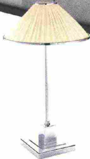
Sopra, abat-jour Soho, con base cromata e paralume in tessuto plissé nella tonalità avorio, Zonca , cm 360x15h.