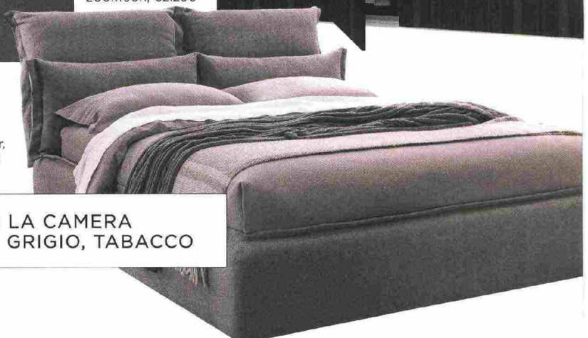
Madia Rigadin, in legno massello lavorato, tinto e verniciato, design Gordon Guillaumier, Alf DaFré ; cm 148x47,5x160h, €4.148.

MASSIMA FORZA ESPRESSIVA PER LA CAMERA MASCHILE. LA PALETTE: MASTICE, GRIGIO, TABACCO