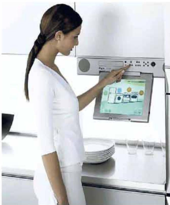
La cucina domotica Snaidero

Grazie agli investimenti, oggi gestiamo questa domanda di sartorialità sia su grandi volumi che su singole richieste».