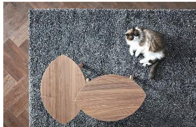
IKEA Il set di due tavolini Stockholm impiallacciati in noce hanno il colore del legno e si adattano a diversi ambienti: fanno parte del nuovo catalogo che punta alla sostenibilità

«L'Italia è molto meglio di come ce la raccontano spiega Annicchiarico. È viva, vitale, orgogliosa. E nei suoi territori custodisce saperi, pratiche e linguaggi che hanno radici molto antiche. L'arte musiva di Spilimbergo è una di queste eccellenze».