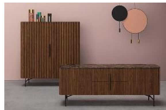
BROSS E ALF DA FRÈ A sinistra, la bergère WAM di Bross (design marco Zito) con la scocca alta e i volumi enfaticizzati, che conferiscono un aspetto fuori scala ma servono ad assorbire rumori e consentire un isolamento perfetto per la lettura. A destra, console della collezione Rigadin di Alf Da Frè , in legno massello di frassino tinto noce