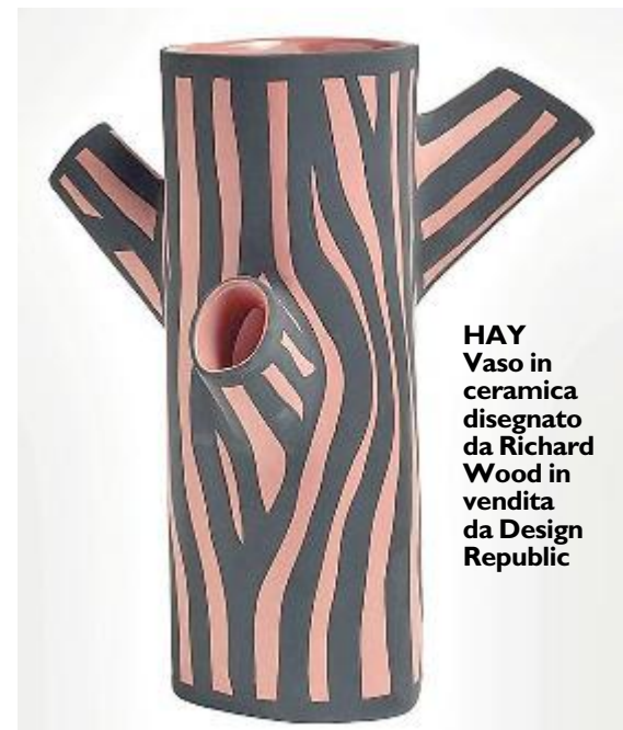
HAY Vaso in ceramica disegnato da Richard Wood in vendita da Design Republic