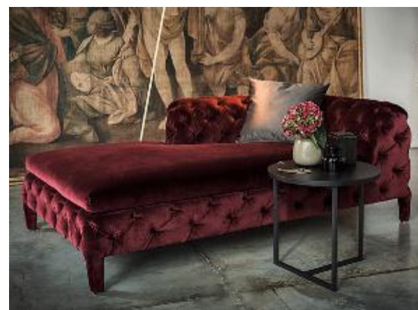
ARKE TIPO Chaise longue classica modello Windsor in velluto color vinaccia realizzata a mano con imbottitura capitonné