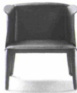
Isabel by Carlo Colombo Flexform www.flexform.it