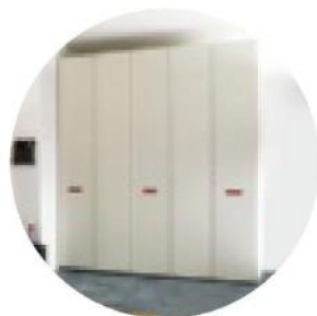
Armadio Comp. NC308 di Moretti Compact ( www.moretticompact.com )