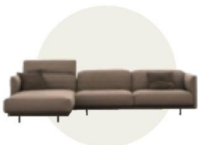
Divano componibile Arlott High di Ditre Italia ( www.ditreitalia.com )