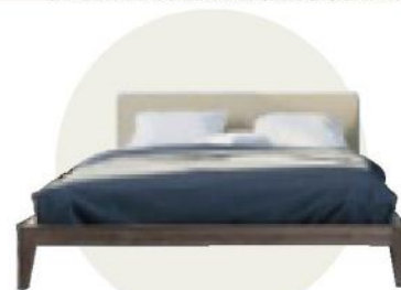
Letto Art. 1693 di Fratelli Mirandola ( www.fratellimirandola.it )