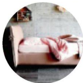
Letto Louise di Bontempi Letti ( www.bontemplettdesign.it )