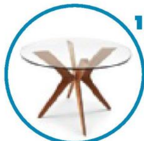
Tavolo Tokyo di Calligaris ( www.calligaris.com )

Che cosa cambia fra le due soluzioni proposte? Il tavolo (1), presente solo nella prima soluzione: di forma rotonda, si inserisce nello spazio d'angolo ed è vicino alla credenza. Si può scegliere anche un modello allungabile perché lo spazio intorno ne consente l'apertura. Poi l'armadio della camera matrimoniale (2), sempre nel primo progetto. I modelli con ante a vetro evocano gli spazi cabina ma hanno profondità standard.