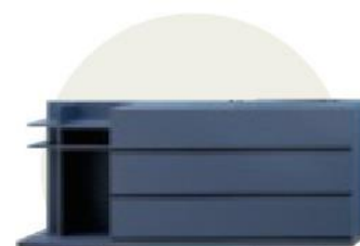
Cassettiera Linea di Alf da Frè ( www.alfdafre.it )