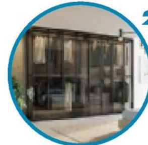
Armadio Open di Giessegi ( www.giessegi.it )