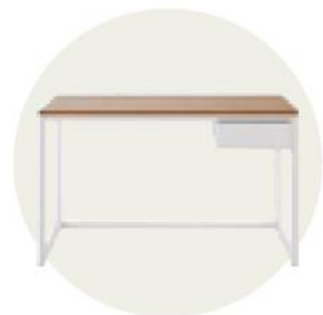
Scrivania Igloo di Maisons du Monde ( www.maisonsdumonde.com )