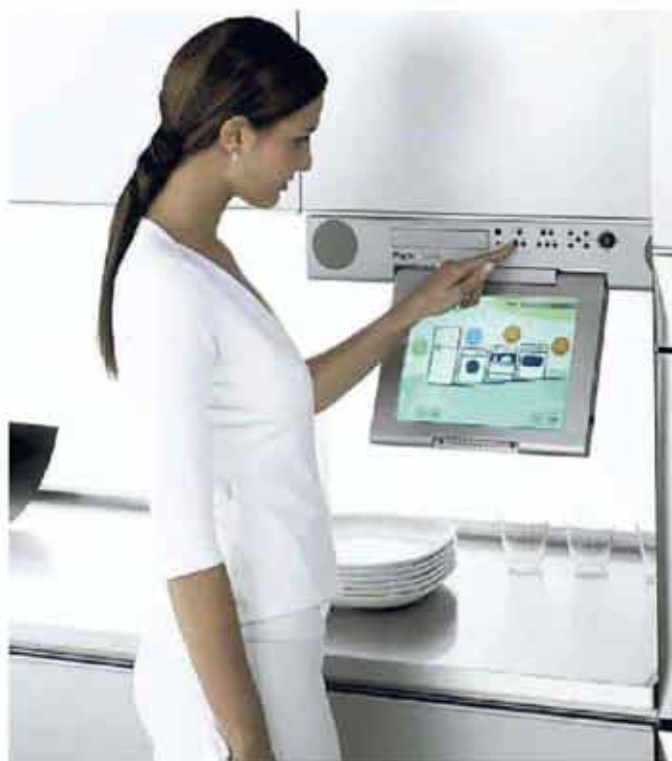
La cucina domotica Snaidero

» Snaidero: «Solo grazie agli investimenti 4.0 gestiamo una domanda sempre più sartoriale»