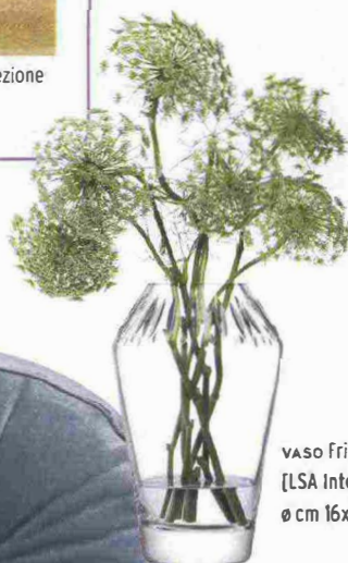
VASO Frieze in vetro [LSA International, ø cm 16x25h €78].