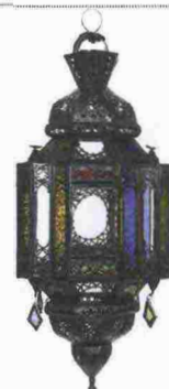
LANTERNA etnica [Suppan & Suppan, ø cm 27x50h €200].

L'arte personalissima di mescolare stili, epoche, colori e materiali. C'è a chi viene spontaneo accostare un divanetto capitonné e una lanterna marocchina, collezioni d'arte e tocchi green. E funziona!