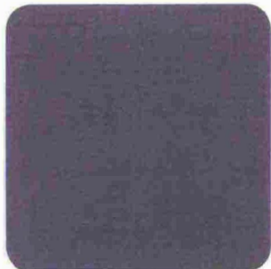
VELLUTO in puro cotone Adamo & Eva [Dedar €129,10 al mt].

La parola ai tessuti, su tutti il velluto nella palette dei viola e rosa. Parquet e tocchi di azzurro per alleggerire.