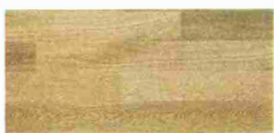
PARQUET a listoni di rovere collezione Legni del Doge [Itlas].