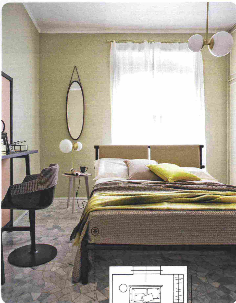
styling Vanessa Pisk foto Giandomenico Frassi (3)

5 Il letto al centro stimola l'inventiva in fatto di punti luce. Per evitare di avere un filo elettrico che va dal letto alla parete (sì, questo è senza dubbio un limite), si può optare per due lampade che scendono dal soffitto sui comodini. Con una presa intelligente wi-fi puoi telecomandarle tramite una app, senza alzarvi da letto [per saperne di più, visita il sito » hivehome.com ].