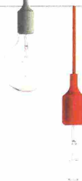
LAMPADA E27 di Mattias Ståhlbom, in gomma colorata con cavo regolabile [Muuto, ø cm 12,5x 23h € 69 l'una].

Tocchi vintage, qualche modanatura, elementi in stile floreale: un mix preciso, per raccontare i fasti di un tempo... che ancora vogliamo vivere!