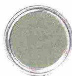
IDROPITTURA finitura Emulsion Matt [Wilson & Morris].