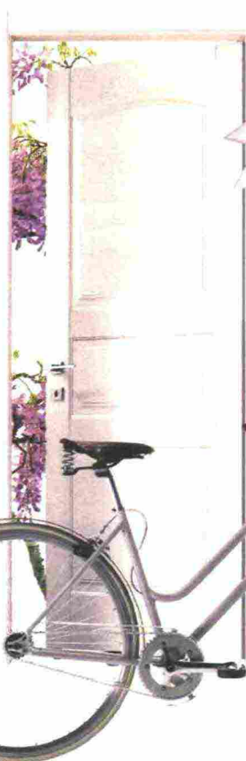
Con dettagli in legno la BICICLETTA Leopolda [Amerigo Milano € 1.388].