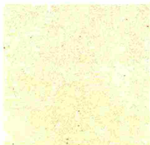
PIASTRELLA monocottura Efeso [Iperceramica, cm 10x10 € 20 al mq].

Se i pavimenti presentano trame 'solide' o mix di pattern, meglio alleggerire le pareti con toni neutri e chiari.