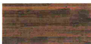
PARQUET in faggio La Baita della collezione Assi del Consiglio [Itlas].