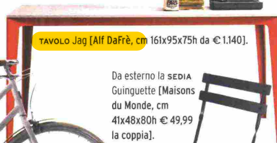
TAVOLO Jag [Alf DaFrè, cm 161x95x75h da € 1.140].