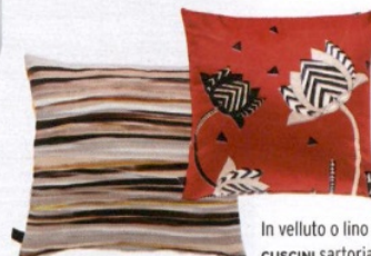
In velluto o lino i CUSCINI sartoriali [Carillo Home, da € 35 l'uno].