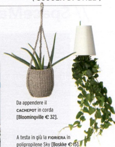
Da appendere il CACHEPOT in corda [Bloomingville € 32].

*.....] Erba tagliata, fiori e germogli che sbocciano nello spray Verde di Kent della collezione Pozione Evocativa [Anna Paghera € 50]. [EG]